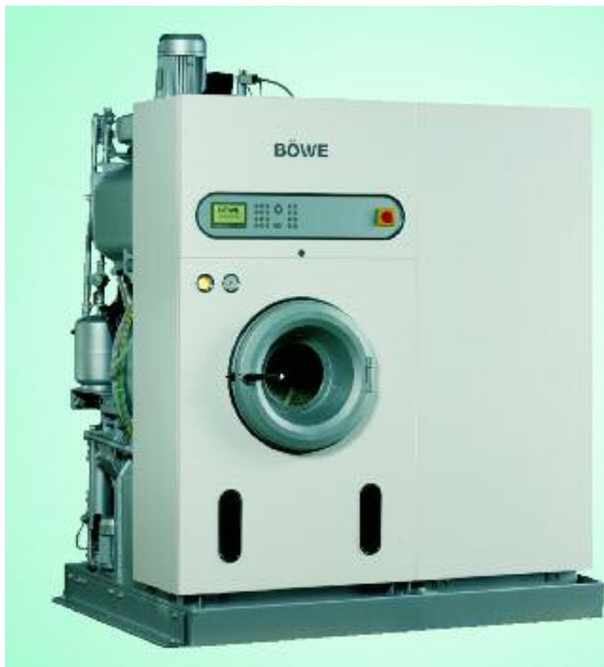
Design élégant et flatteur pour votre magasin