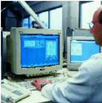
Böwe Direct Connect diagnostique à distance intégré dans la machine

BÖWE Textile Cleaning GmbH Rumplerstraße 2 D-86159 Augsburg, Allemagne Téléphone: + 49 (0) 821 5707-0 Fax: + 49 (0) 821 5707-200 E-mail: trade@boewe-tc.de www.boewe-tc.de