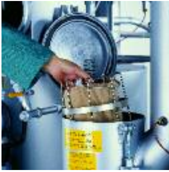
trappes pour filtre à poussière et filtre à épingle : le design rond élimine les amas de peluches