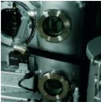
Le nouveau, l'unique séparateur d'eau BÖWE