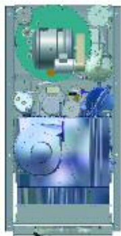
Slimline - Étroite : le distillateur est placé derrière le tambour

En développant la P12, la P15 et la P18 notre première idée était d'obtenir le plus faible encombrement dans le magasin. Ces machines sont disponibles en version étroite ou large pour une configuration la plus appropriée pour votre affaire et avec une machine dont la hauteur est inférieure à 2000 mm.