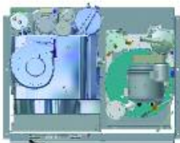
Crossline - Large : le distillateur est placé à côté du tambour